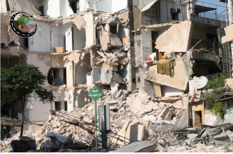
هكذا فعلت البراميل المتفجرة