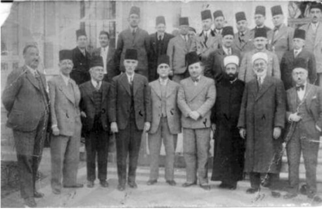
كتلة برلمانية من نواب (اخوان مسلمين - محافظين - أرمن)