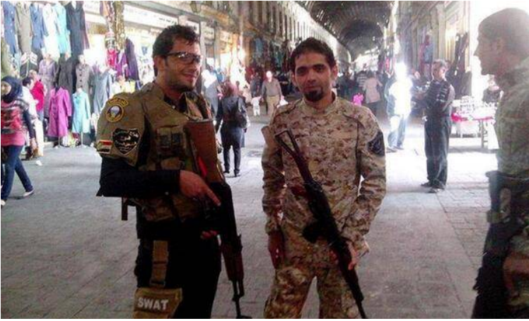
جنود من ميليشيا عراقية شيعية في سوق الحميدية دمشق