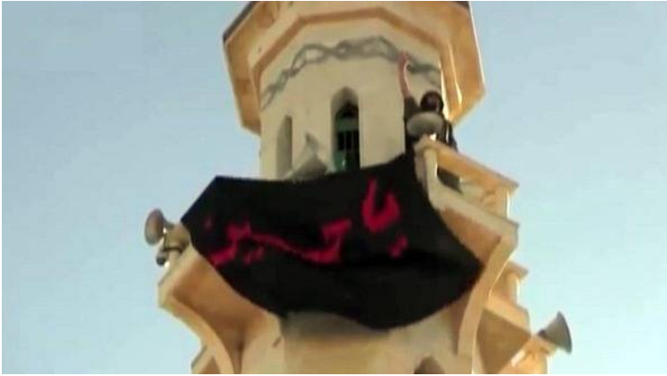
راية طائفية شيعية على مسجد للسنة في بلدة القصيرريف حمص

دعوات لحماية المراقد الشيعية وتحريض وحشد طائفي و دعوات للتقرب إلى الله بقتل السنة، سهلت استقدام النظام أفراداً ومجموعات شيعية إلى أن ظهرت بشكل معلن وسياسي ولا سيما في معركة القصير حيث رفع عناصر ميليشيا حزب الله الأعلام الشيعية فوق المساجد السننية في نيسان عام ٢٠١٣.