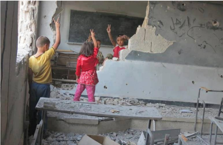
الأطفال يشيرون إلى مروحية تحمل البراميل المتفجرة