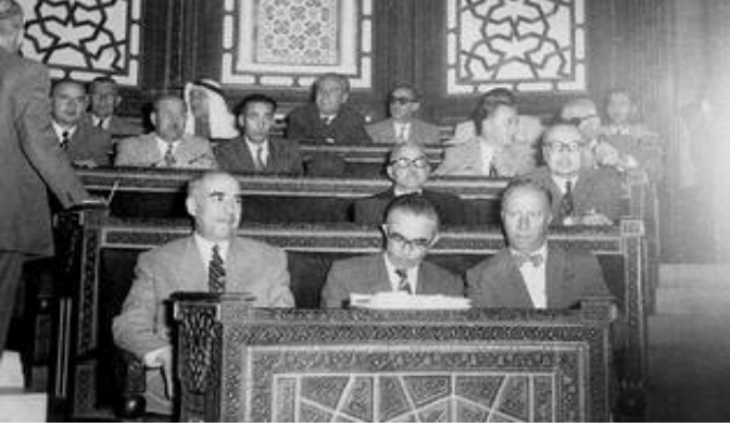
البرلمان السوري في الخمسينيات