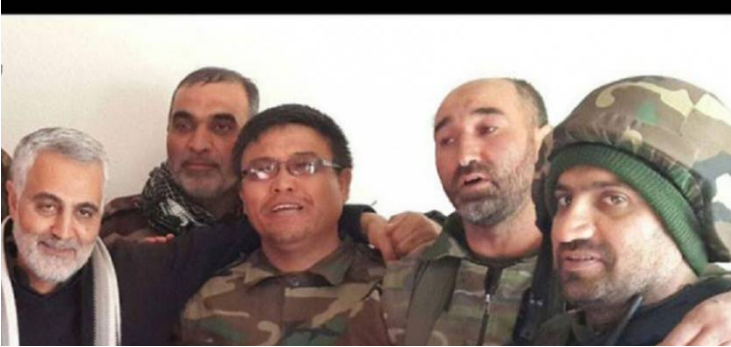
قاسم سليمانى وقريب الرئيس السوري