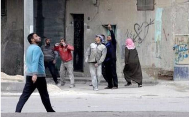
حلب ٢٠١٤ سكان محليون يراقبون سقوط البراميل

https://www.youtube.com/watch?v=jHQuQYTOTIo (١)