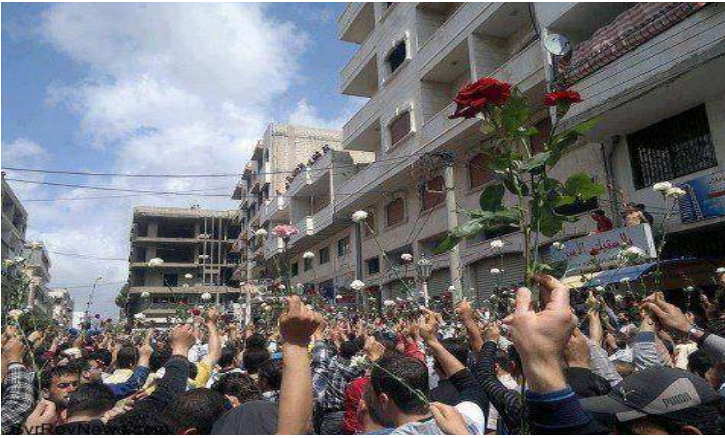
داريا ريف دمشق ٢٠١١ (١)