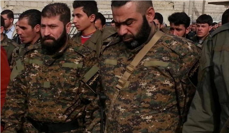
ميليشيا السيدة زينب الشيعية في دمشق