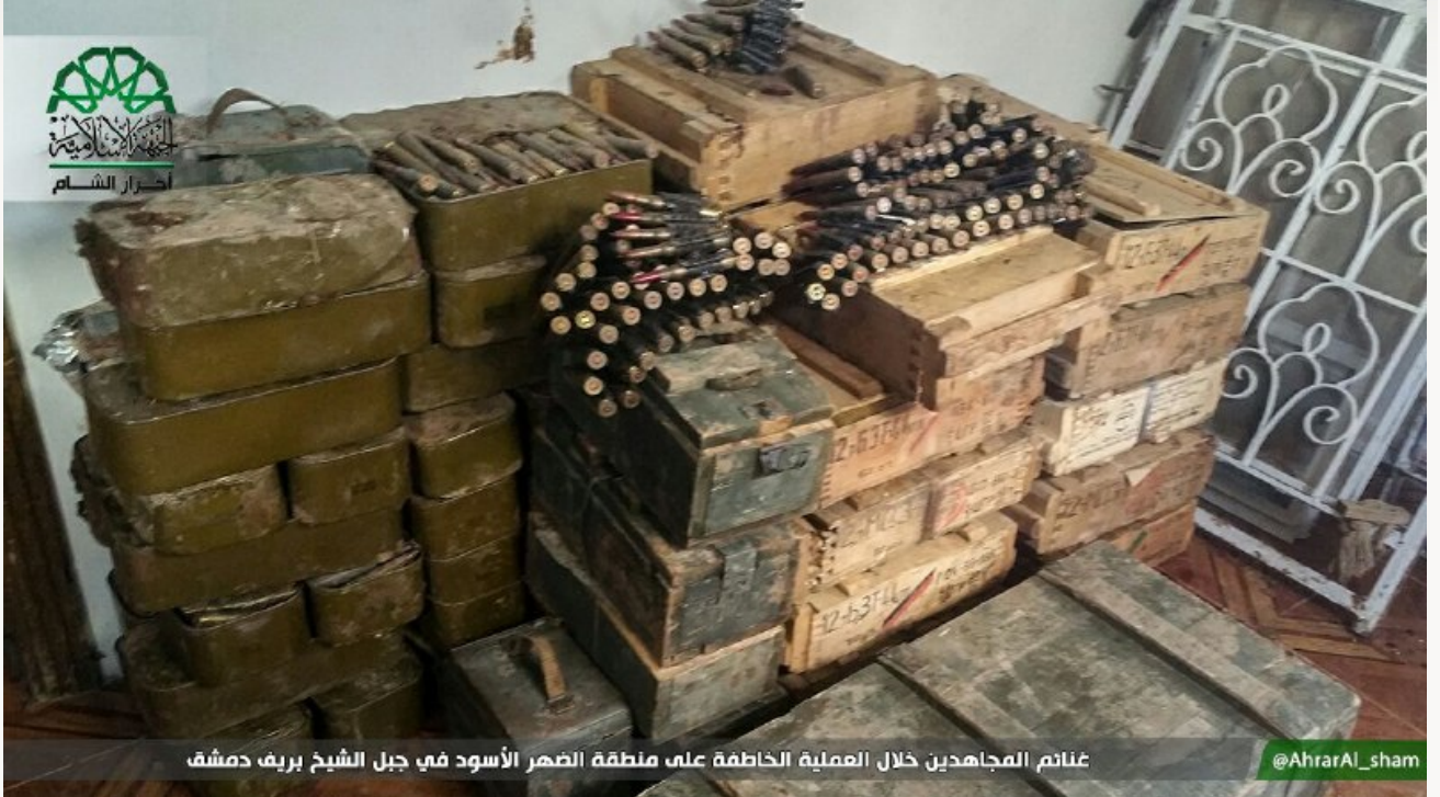
غنائم المجاهدين خلال العملية الخاطفة على منطقة الضهر الأسود في جبل الشيخ بريف دمشق