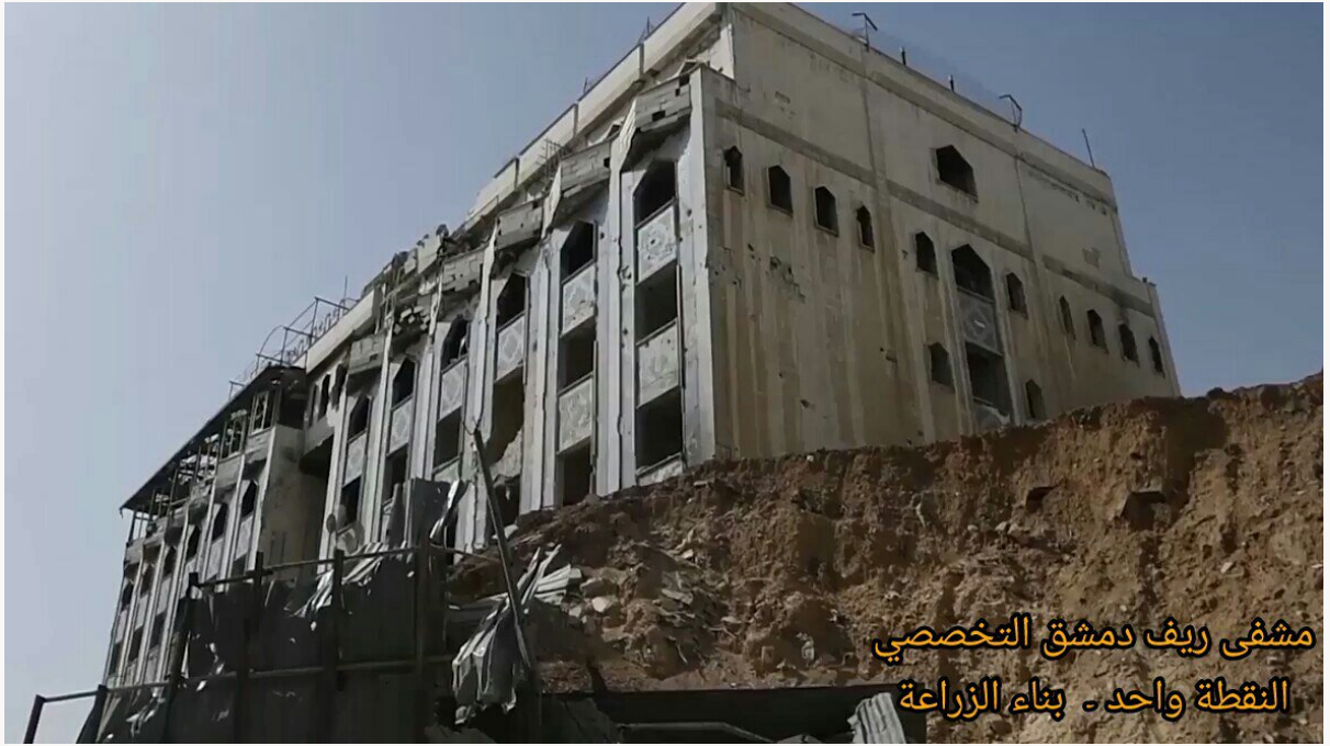
مشفى ريف دمشق التخصصي النقطة واحد - بناء الزراعة

١٣- تظهر في الصورة مشفى ريف دمشق التخصصي (النقطة واحد) المحصنة بشكل كامل، والتي تقع تحت بناء الزراعة قرب دواء الشهداء بمدينة دوما في الغوطة الشرقية.