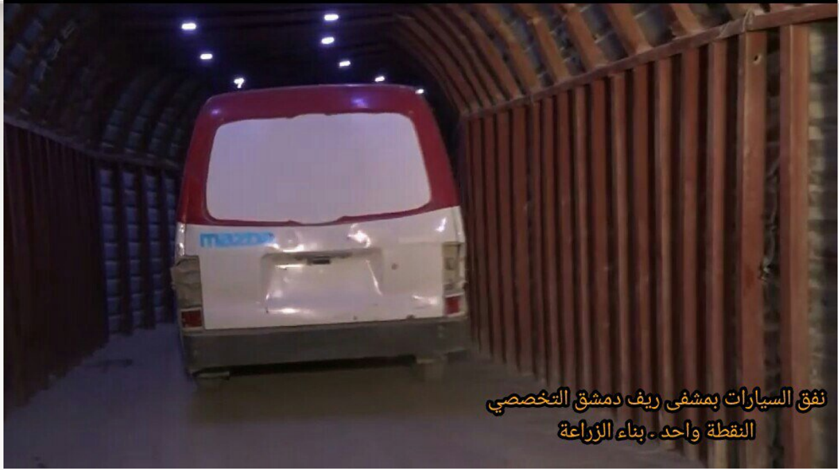
نفق السيارات بمشفي ريف دمشق التخصصي النقطة واحد - بناء الزراعة

١٧- نفق سيارات الإسعاف الذي يمتد من داخل مشفى ريف دمشق التخصصي (النقطة واحد) إلى أنفاق أخرى بمدينة دوما في الغوطة الشرقية.