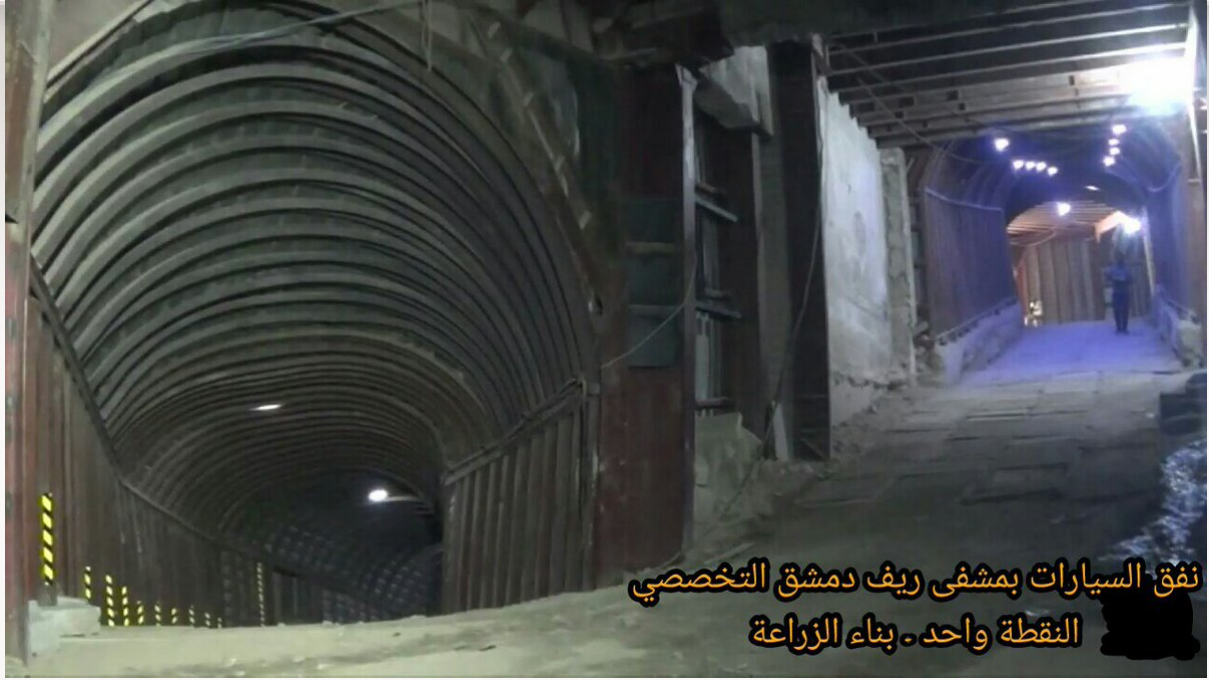
١٩- من داخل مشفى ريف دمشق التخصصي (النقطة واحد) التي تقع تحت بناء الزراعة قرب دوار الشهداء بمدينة دوما في الغوطة الشرقية.