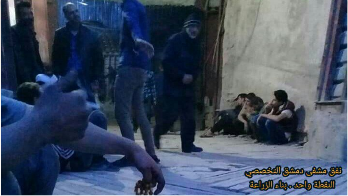
١٥- نفق سيارات الإسعاف الذي يمتد إلى داخل مشفى ريف دمشق التخصصي (النقطة واحد) بمدينة دوما في الغوطة الشرقية.