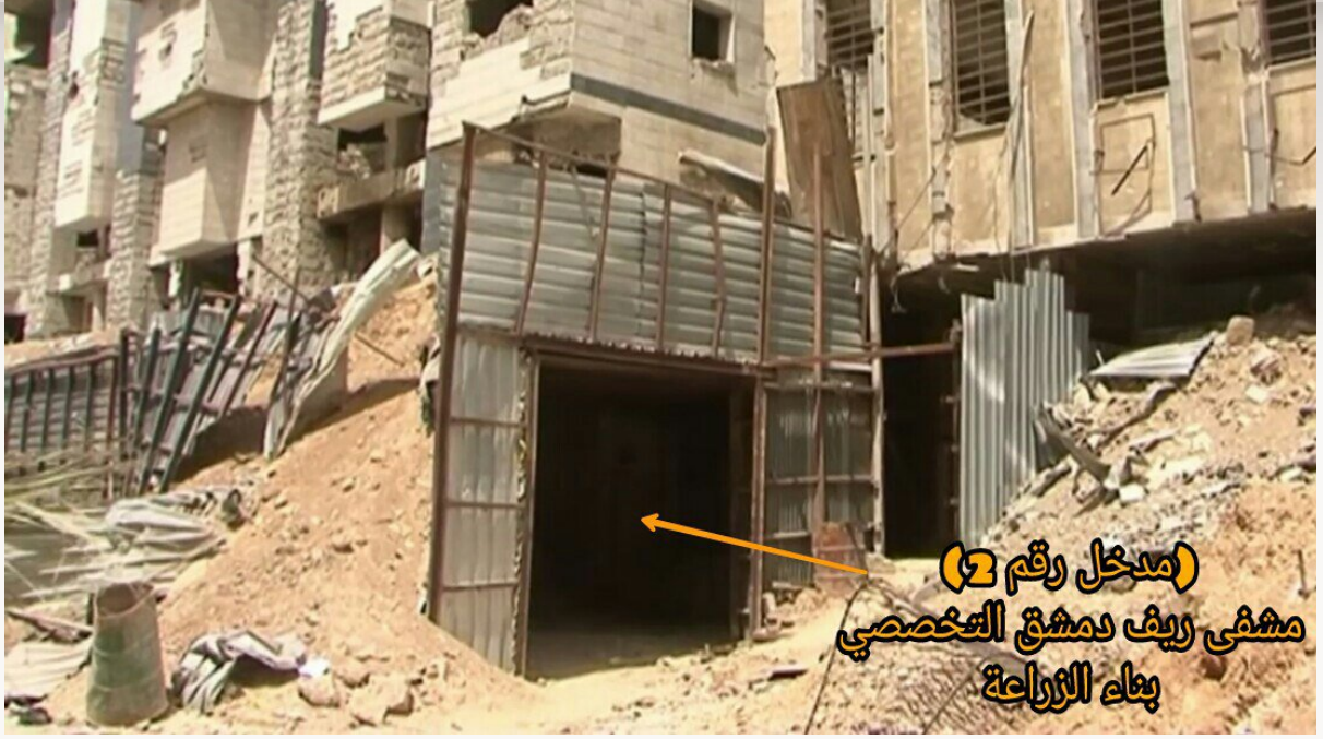
(مدخل رقم 2) مشفى ريف دمشق التخصصي بناء الزراعة

١٣- تظهر في الصورة مشفى ريف دمشق التخصصي (النقطة واحد) المحصنة بشكل كامل، والتي تقع تحت بناء الزراعة قرب دواء الشهداء بمدينة دوما في الغوطة الشرقية.