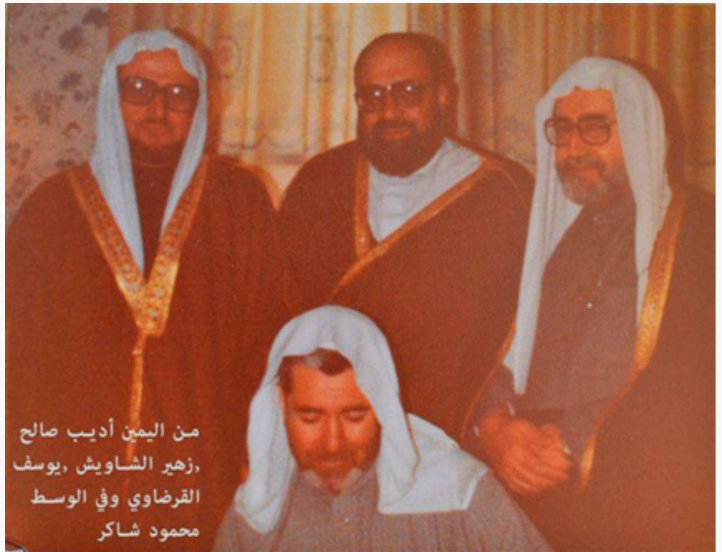
من اليمين أديب صالح زهير الشاويش, يوسف القرضاوي وفي الوسط محمود شاكر